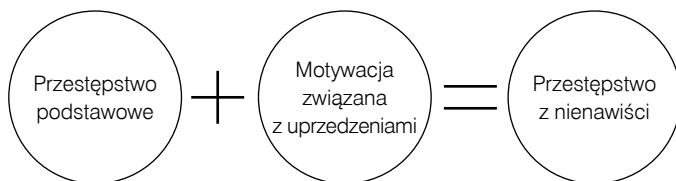
Rysunek 1. Definicja przestępstwa z nienawiści