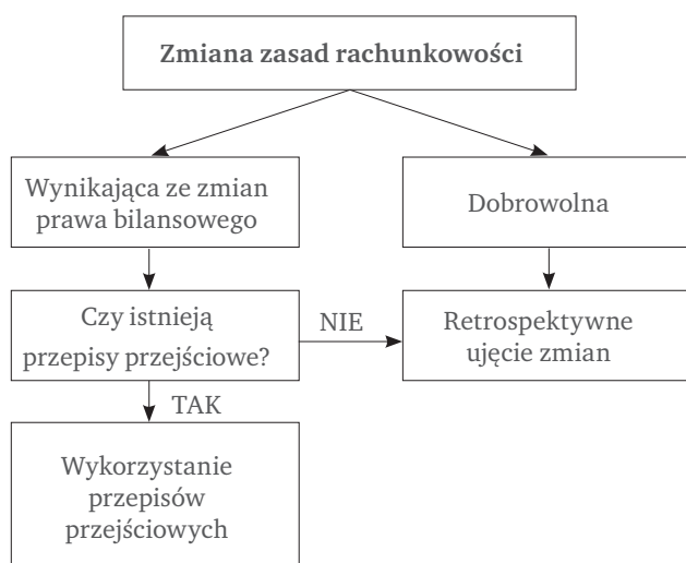
Rys. 2. Schemat postępowania w razie zmiany zasad rachunkowości