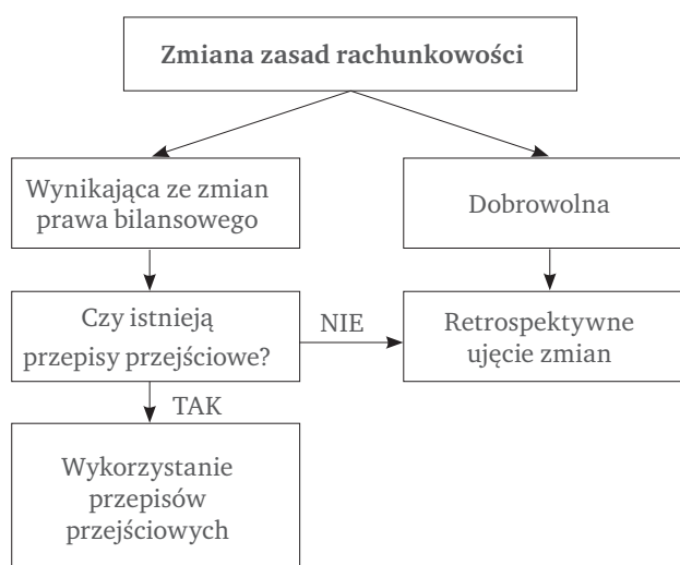
Rys. 2. Schemat postępowania w razie zmiany zasad rachunkowości