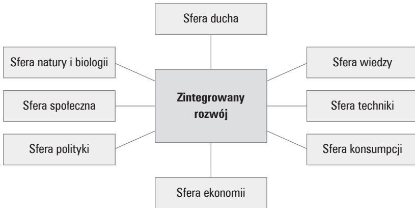
Rysunek 1.1. Sfery egzystencji jednostki i społeczeństwa w kontekście rozwoju zintegrowanego

W interdyscyplinarnym podejściu wzorcowym układem odniesienia jest zatem system ekonomiczny umożliwiający zintegrowany lub inaczej zharmonizowany rozwój tych sfer (zob.: rys. 1.1).